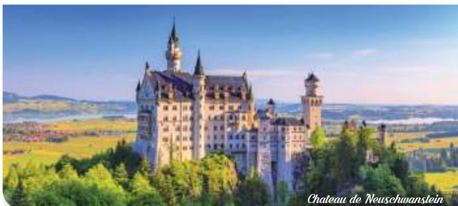
Chateau de Neuschwanstein